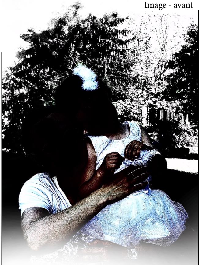
Image - avant